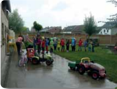
Bezoek aan een kinderboerderij