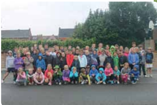
Sportstages tijdens de zomervakantie